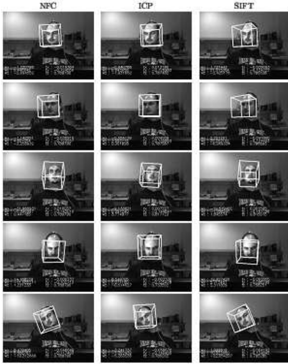
Şekil 3. 90, 100, 180, 240, 360. karelerde NFC, ICP ve SIFT algoritmalarından elde edilen sonuçlar. 90 ve 100. karelerde aydınlanmanın yarattığı deęişimler görülebilir.

edilen mutlak ortalama hata ve deęişintileri görülebilir. Tablo 2'deki verilere göre SIFT yöntemi dönme ve ötelemelerde dięer yöntemlere göre daha iyi sonuç vermiştir. Şekil 3'te ise zamana baęlı aydınlanma deęişiklikleri altında yöntemlerin sonuçları, girdi imgeleri üstüne bindirilerek gösterilmektedir.