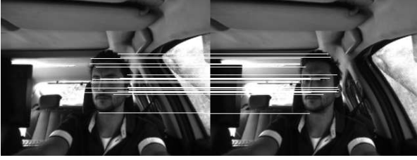
Şekil 2. SIFT ile eşleştirilen noktalar

ile eşlenir. Şekil 2 de yüz için hesaplanıp eşleştirilmiş noktalar gözükülmektedir.